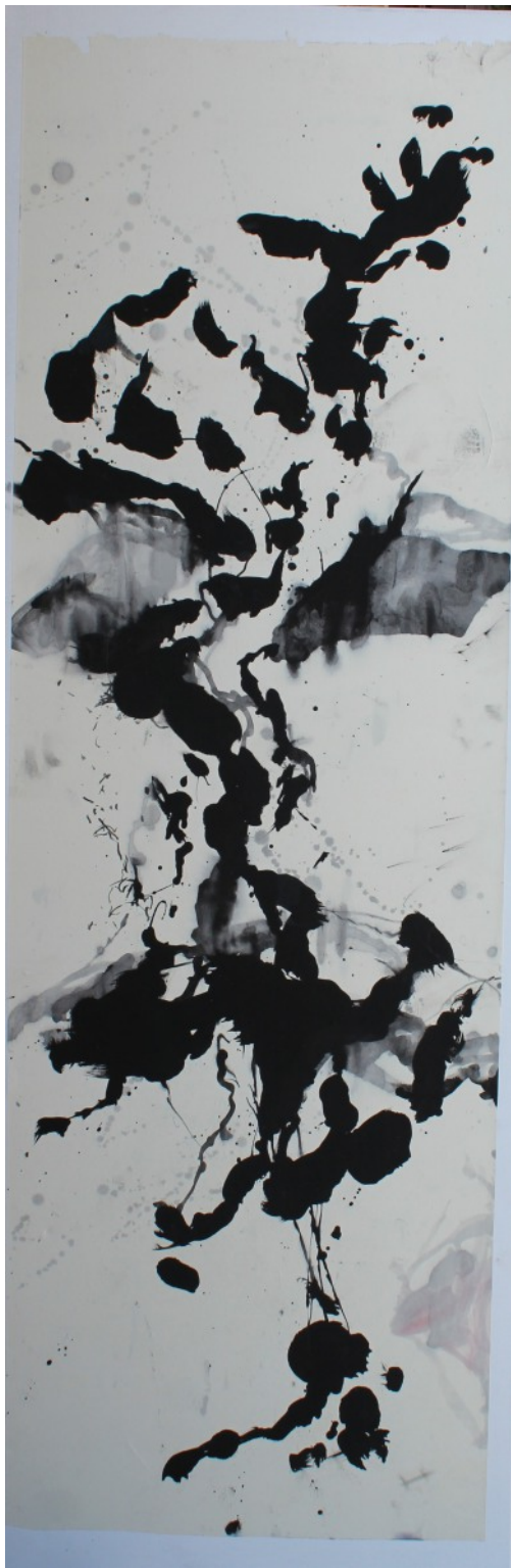
CT Encre sur papier marouflé sur toile 150x50 cm