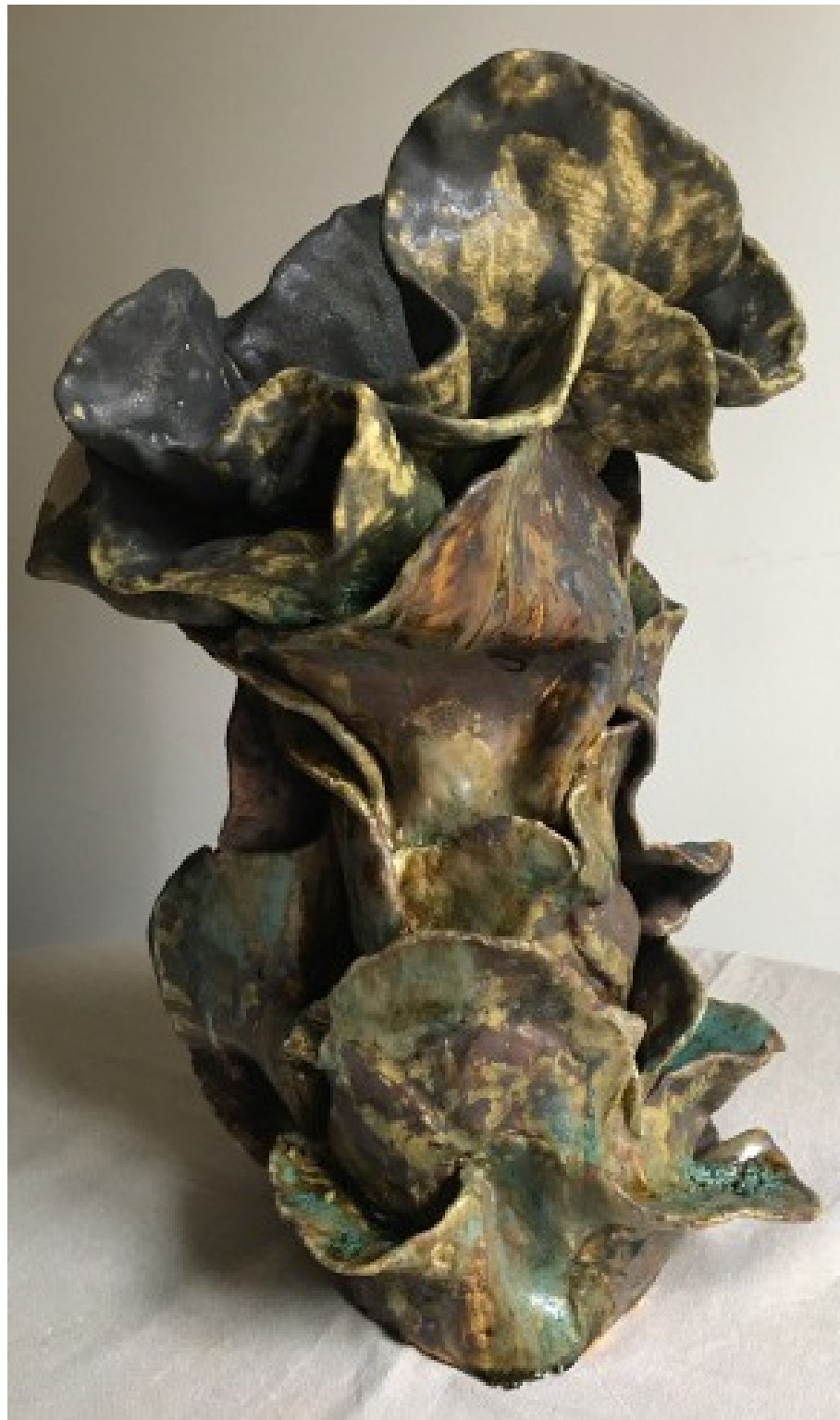
ND Série sous bois 50x25x23 cm grès émaillé