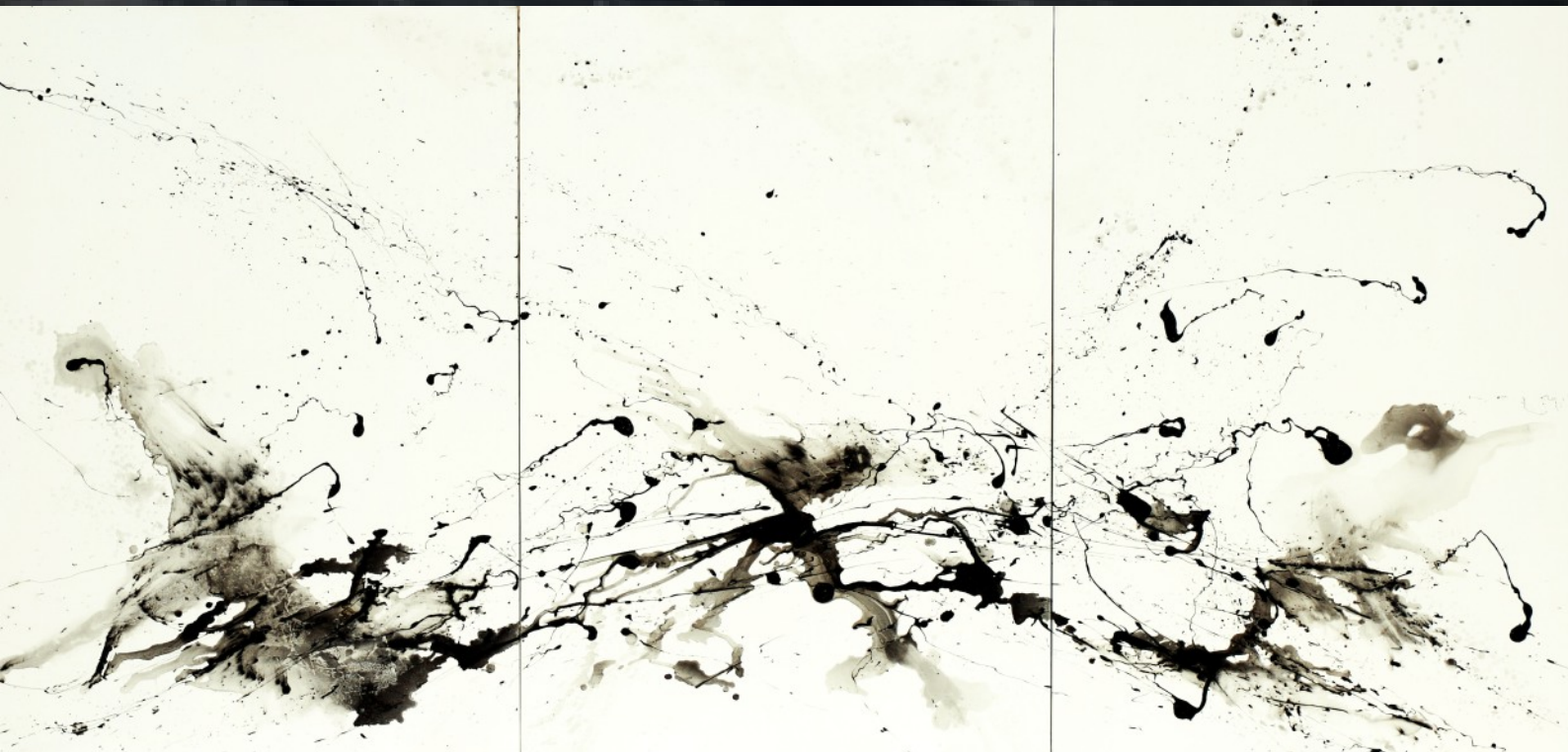
C Tartanac triptyque huile sur toile 342 x 162 cm