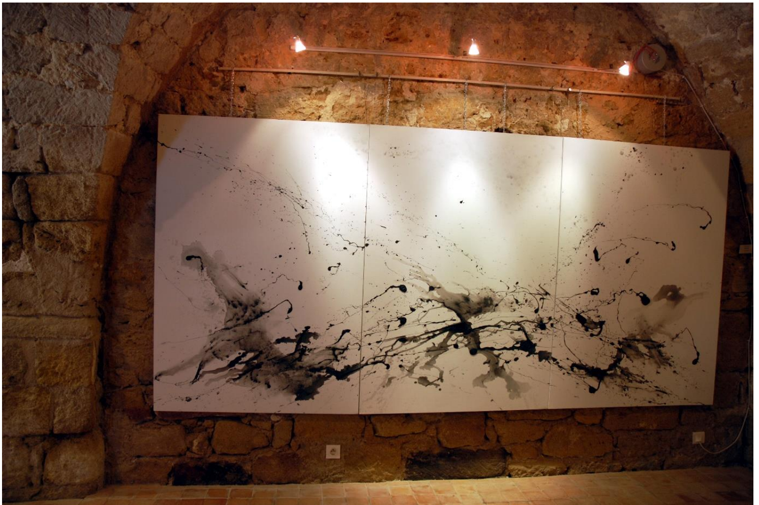
NEIGES NOIRES / huile sur toile / 300 x 150 cm / Château LOURMARIN 2012