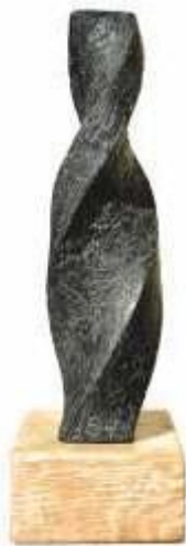
Torsion, terre cuite, hauteur 25 cm, 2016.