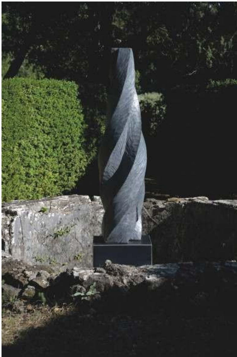
Torsion, cyprès, hauteur 220 cm, 2017.

Ce travail s'inscrit dans l'éternel conflit du chaos et de la forme.