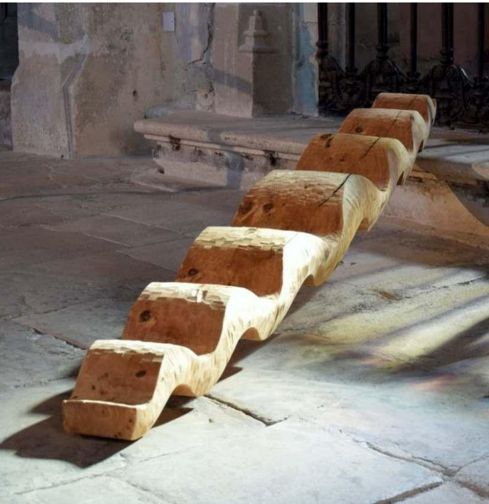
Vague, cyprès, longueur 250 cm, 2018.