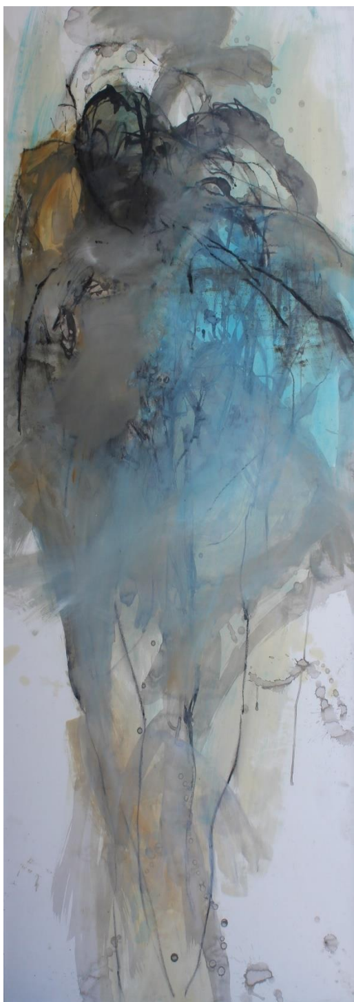
GEANTS / huile sur papier / marouflé sur toile / 150 x 65 cm