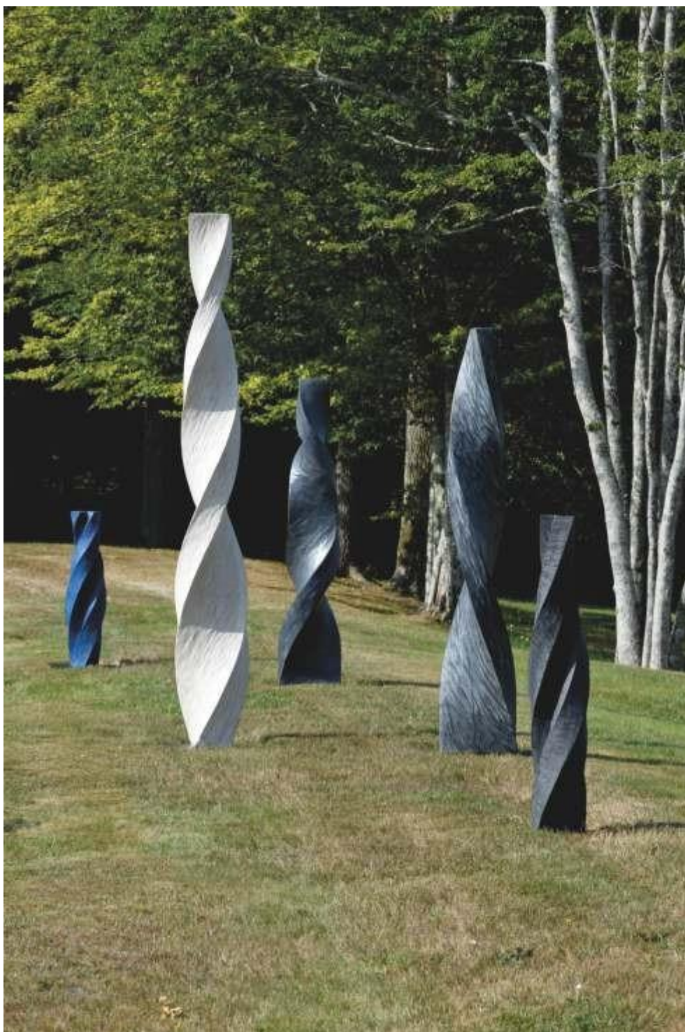
Biennale de sculpture en Sologne, 2017.