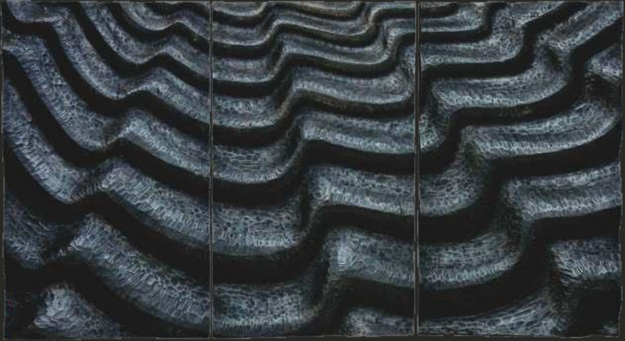
Flottement, mahogany, 3 x ( 70 x 44 cm ), 2015.