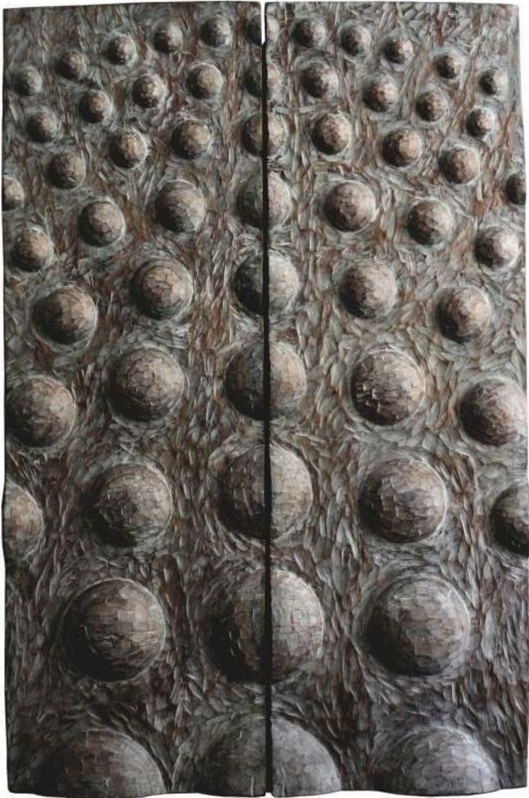
Galets, bois royal, 2 x ( 35 x 108 cm ), 2008.