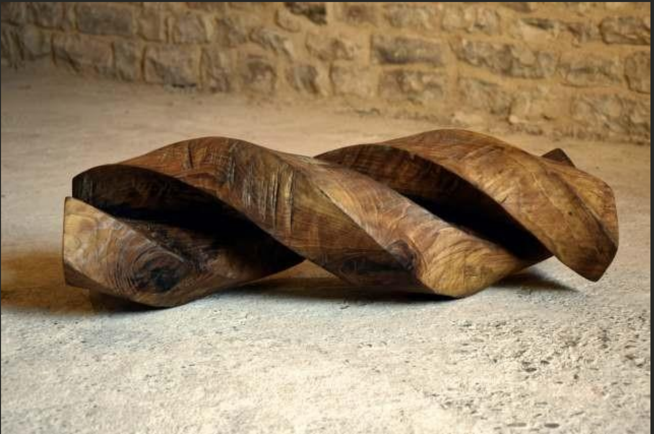
Torsion, noyer, longueur 70 cm, 2019.