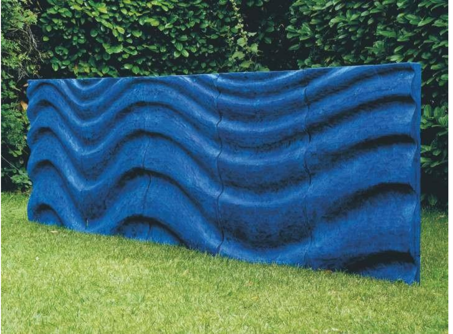
Vagues, pin, 5 x ( 65 x 95 cm ), 2012.