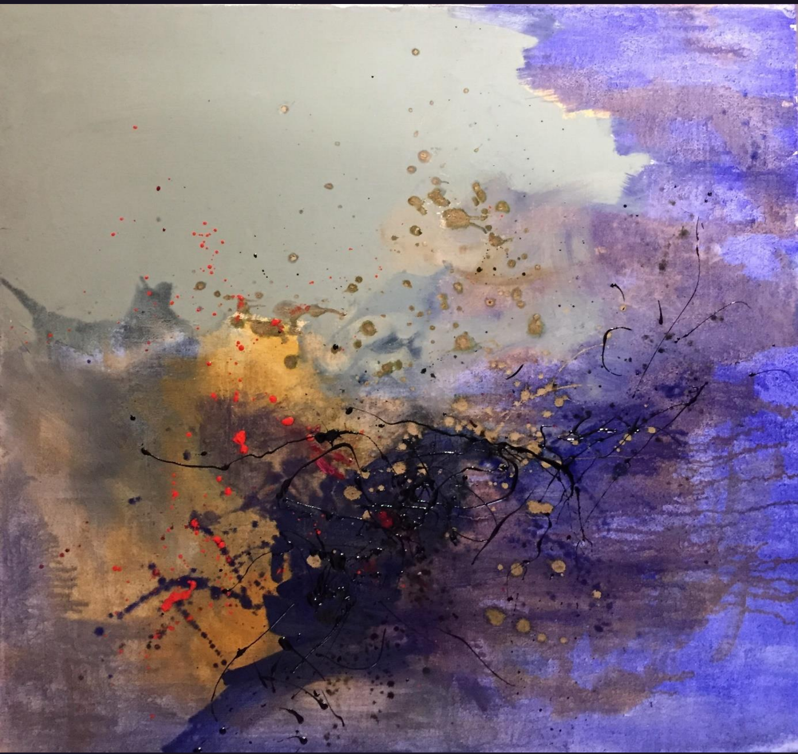
SANS TITRE huile sur toile 80 x 80 cm