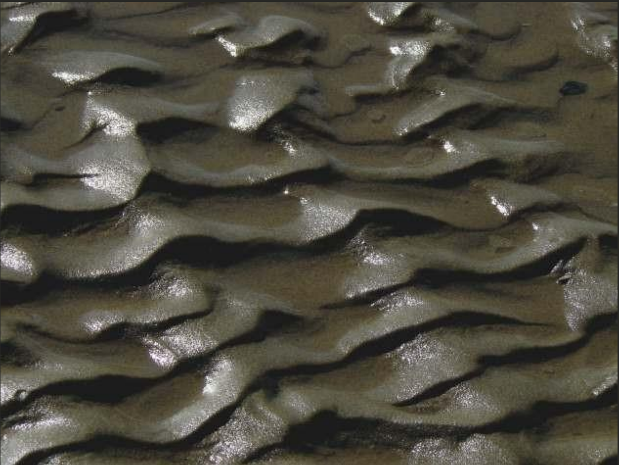
Eau, tirage numérique, 2013.