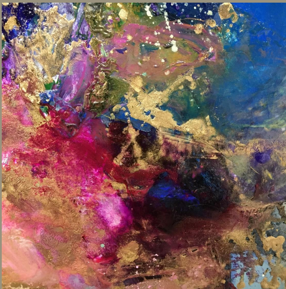
SANS TITRE huile sur toile DETAIL 100x100cm photo ©