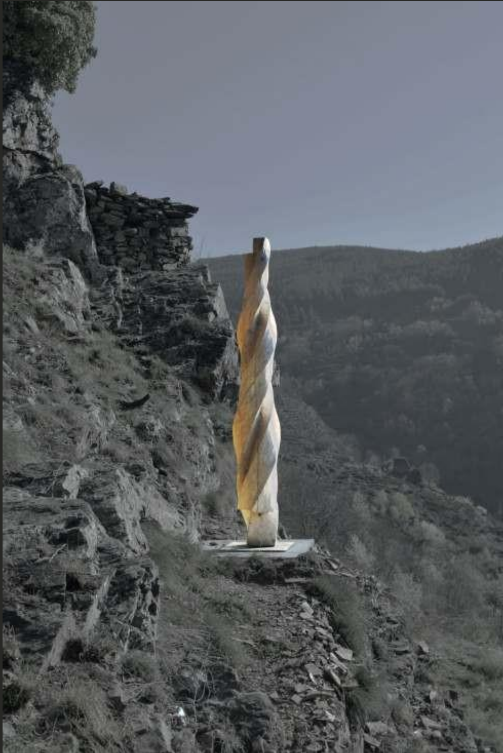
Torsion, douglas, hauteur 300 cm, 2017. Altier en Lozère.

Ce qui m'intéresse, ce sont des choses que je crois immuables... Dans mon travail, j'essaie d'introduire des notions de durée, de temps ou d'infini.