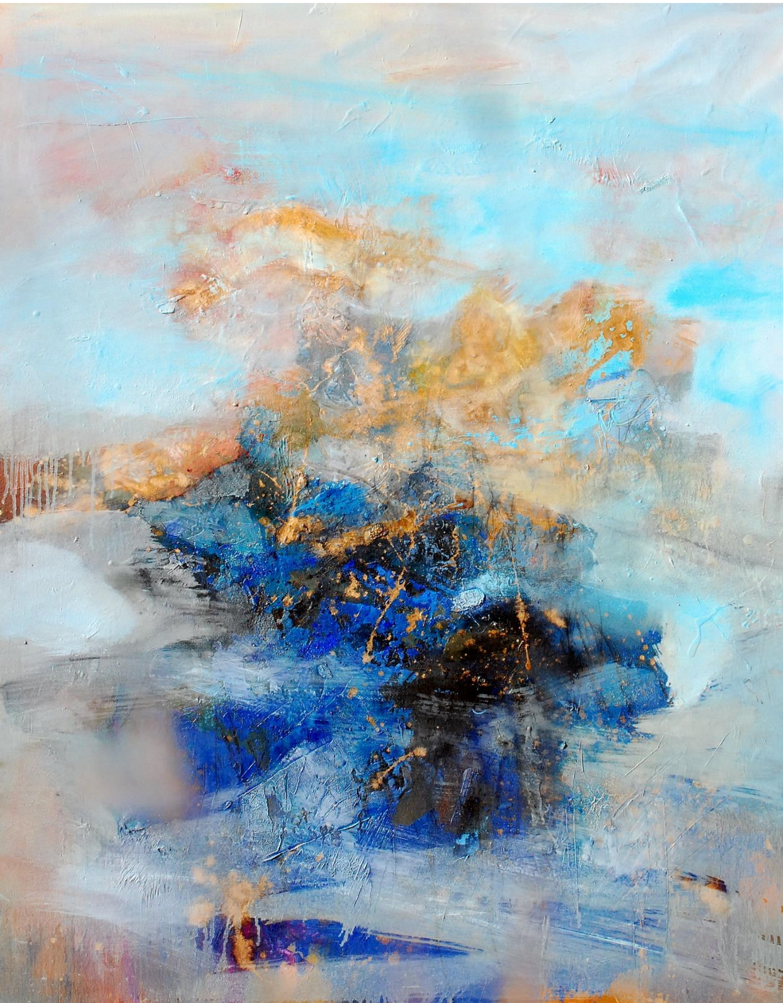
SANS TITRE HUILE SUR TOILE 116 X 89 CM PHOTO ©