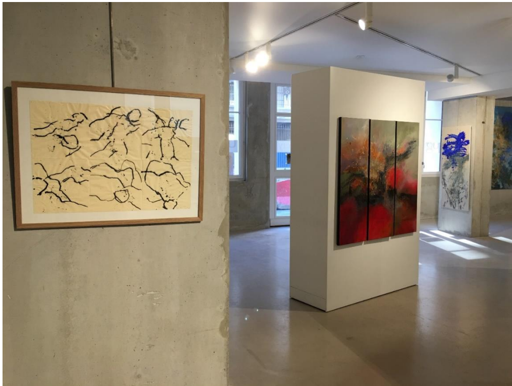
Urban gallery/ Marseille expo 2019/ photo©