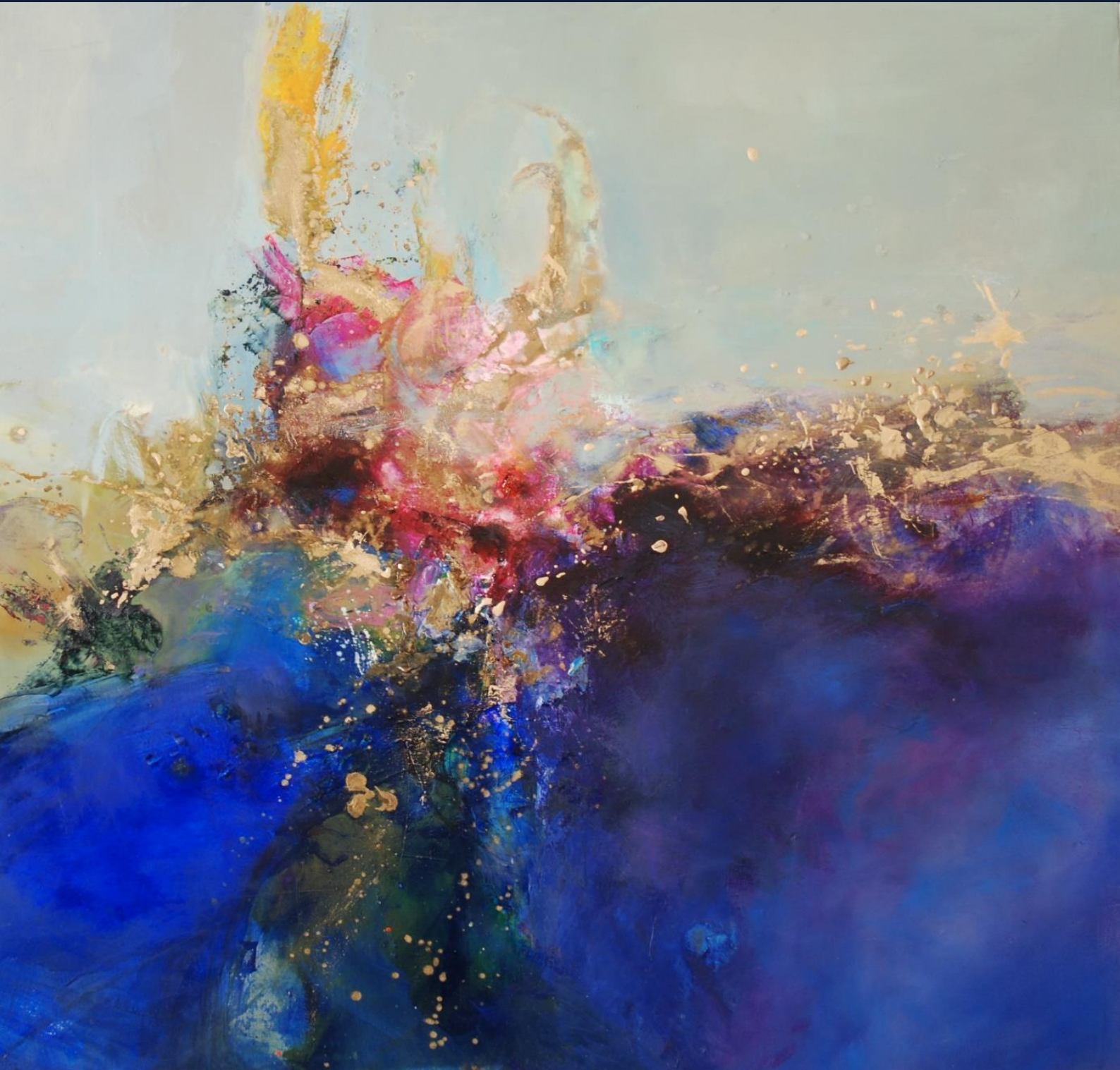
SANS TITRE huile sur toile 100 x100cm photo ©