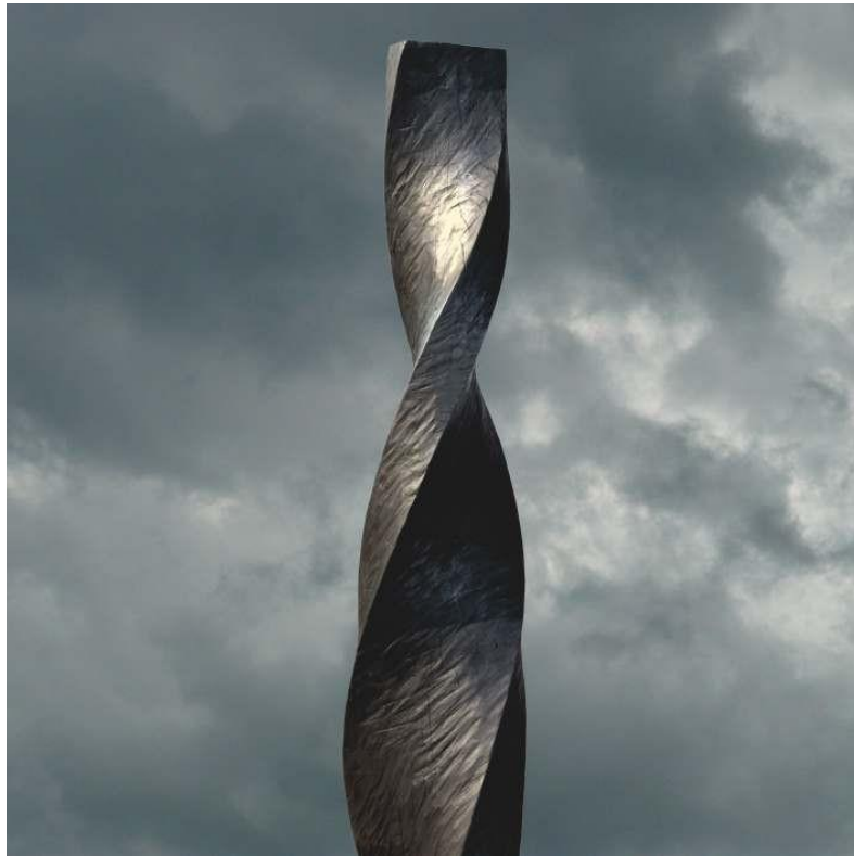
Torsion, cèdre, hauteur 230 cm, 2016.