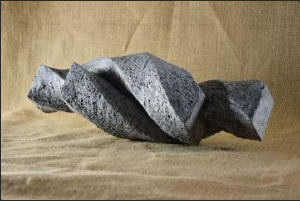
Torsion, terre cuite, longueur 40 cm, 2018.