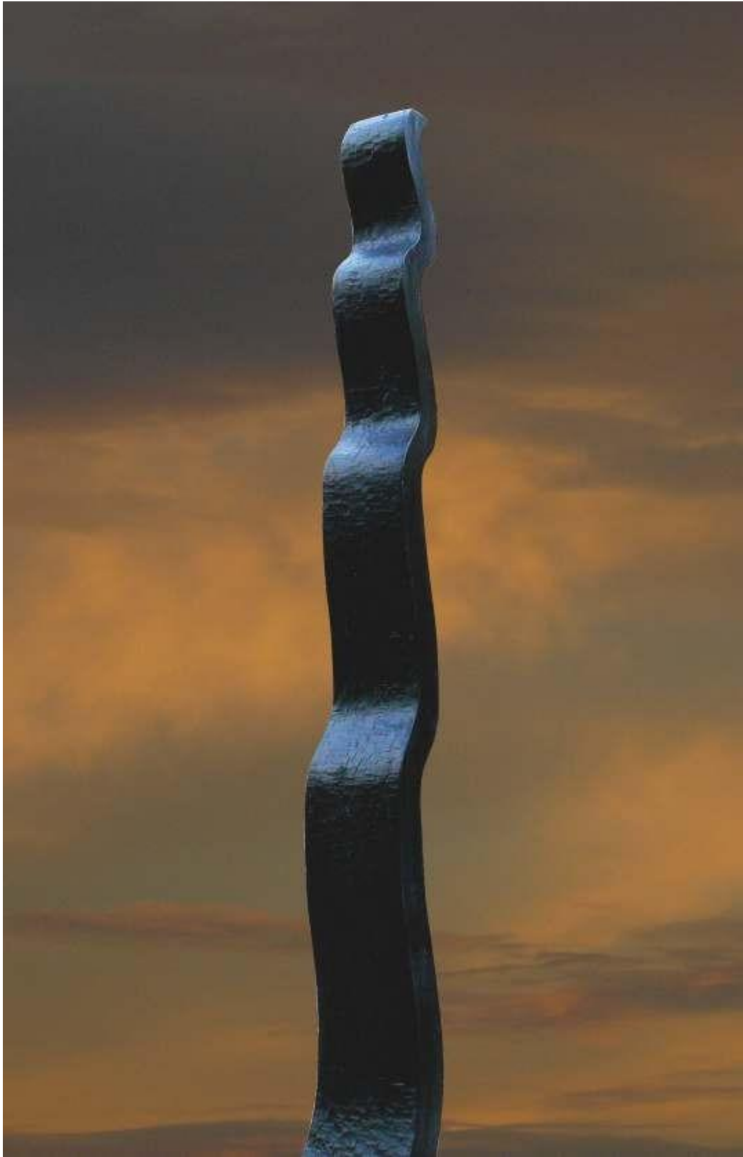
Flottement, cyprès, 30 x 25 x 220 cm, 2015.