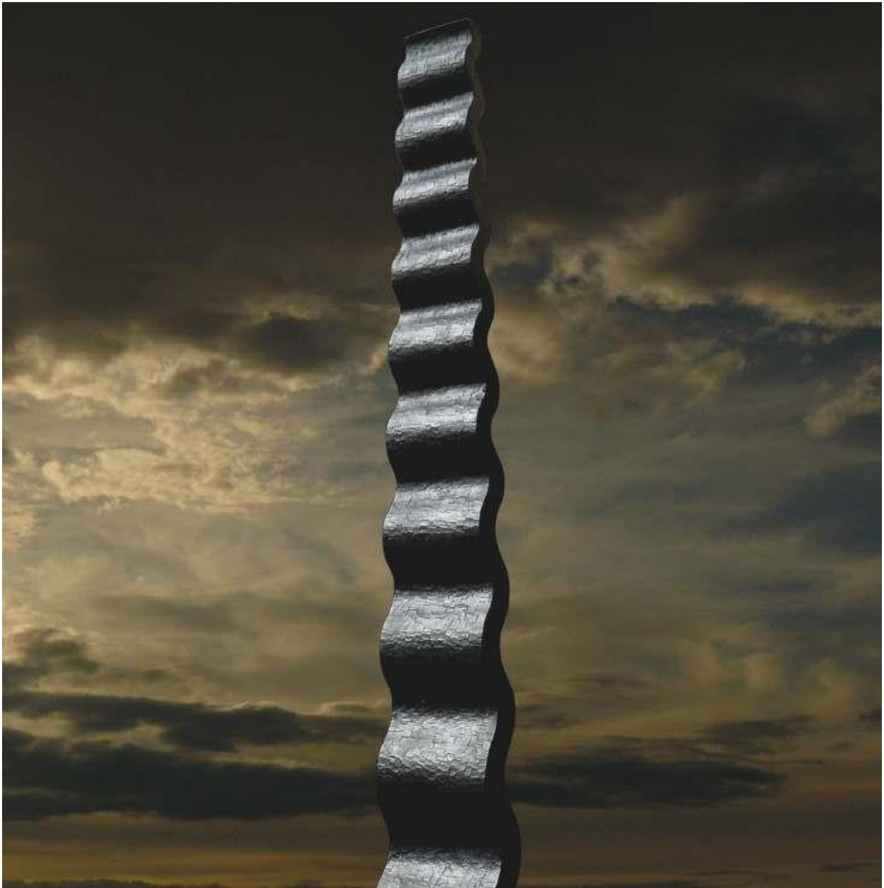
Flottement, cyprès, 40 x 20 x 300 cm.

Ces formes veulent répondre à la trépidation quotidienne par une quête de sérénité et d'équilibre.