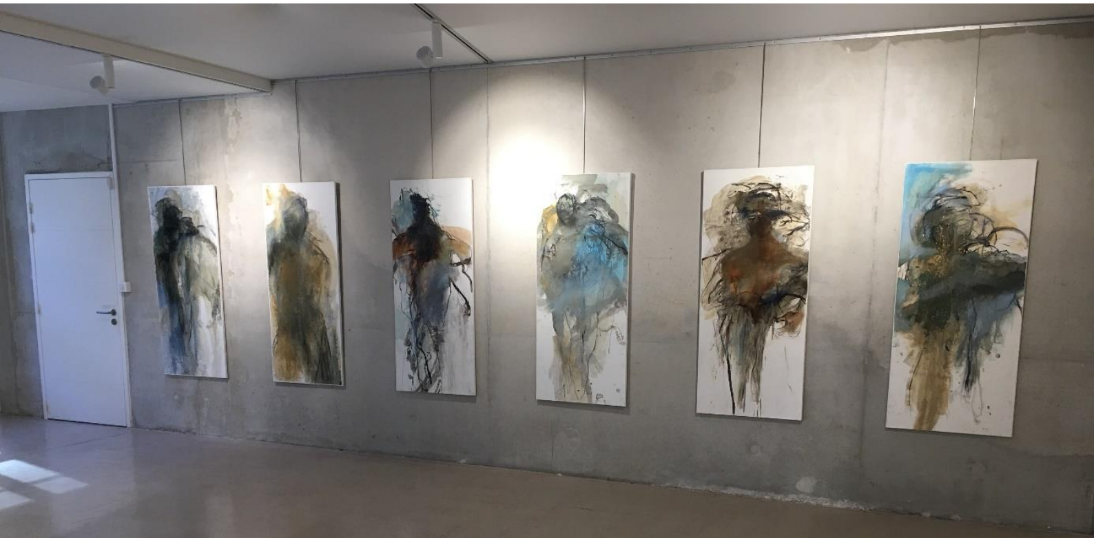
Urban gallery/ Marseille expo 2019/ photo©