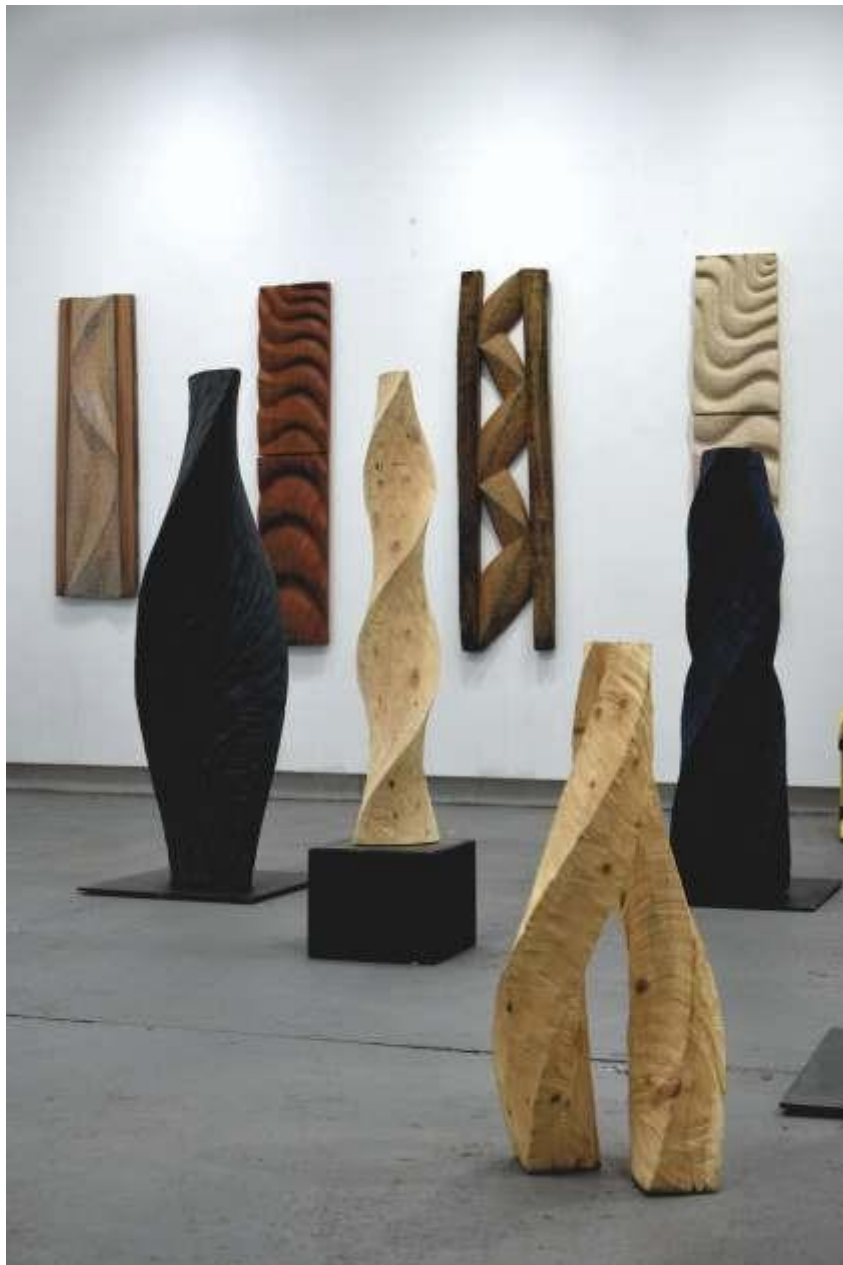
Le Hangar, Bayonne, 2018.