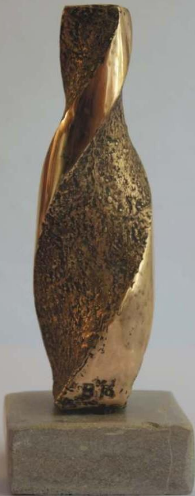
Torsion, bronze, hauteur 22 cm, 2016.