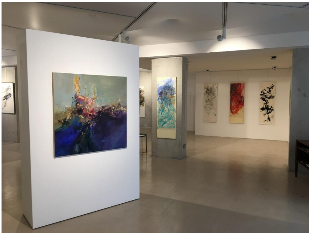
Urban gallery/ Marseille expo 2019/ photo©