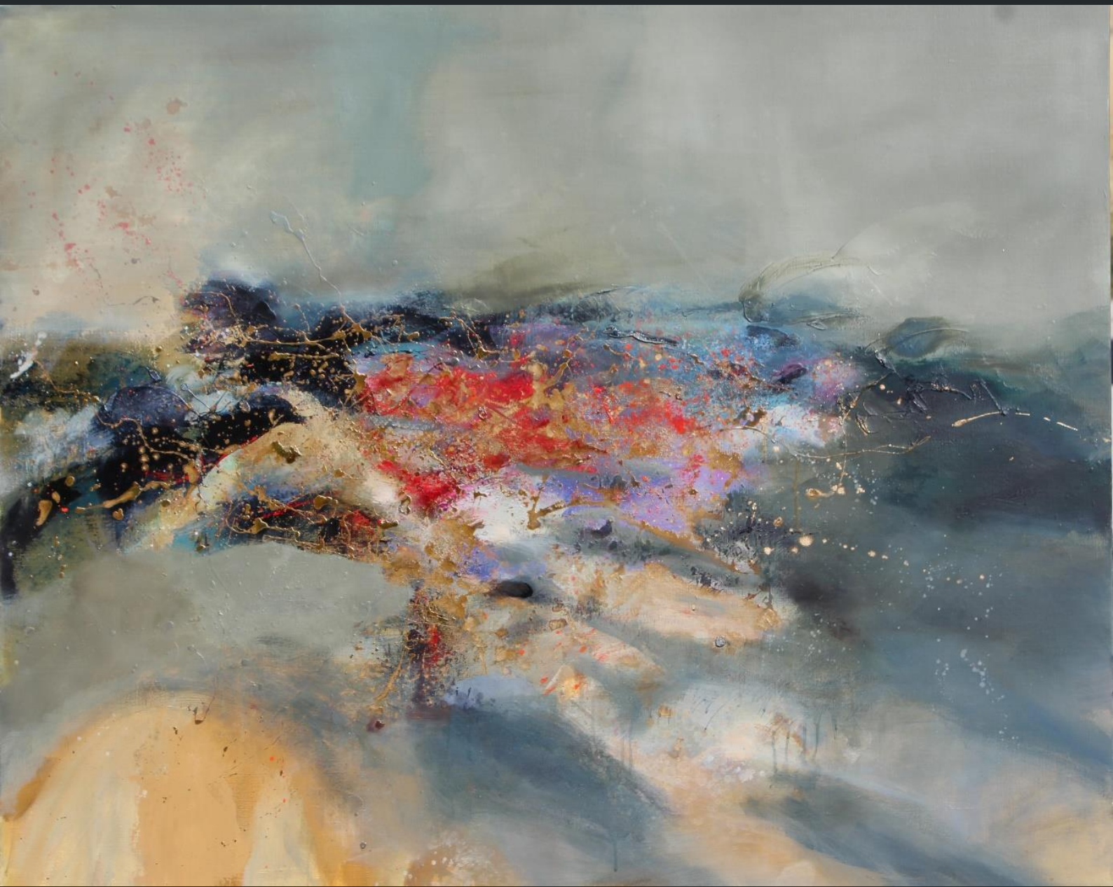
SANS TITRE huile sur toile 116 x 90 cm