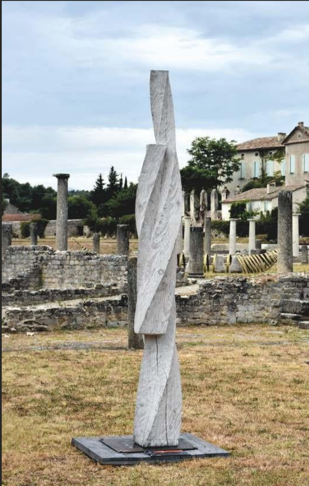
Torsion, douglas, hauteur 300 cm, 2018. Sites antiques de Vaison-la -Romaine.