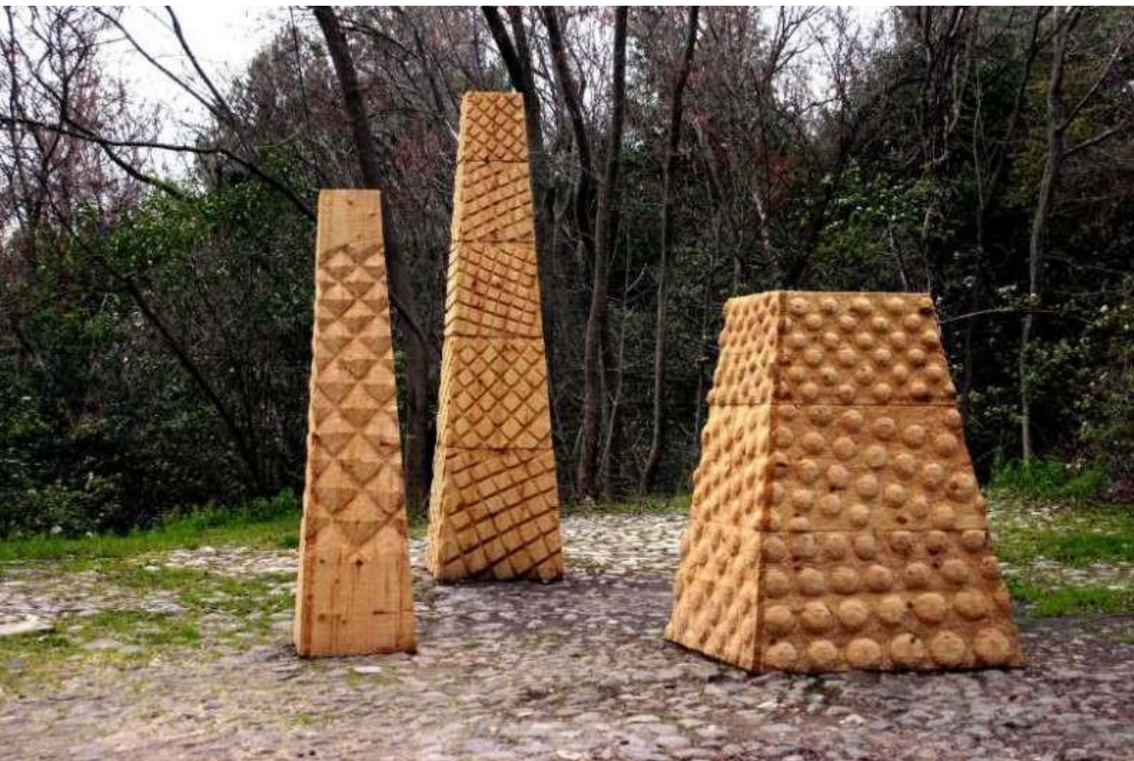
Rochers et Galets, sapin, hauteur 170, 220, 270 cm, 2007. Parc de l'atelier de Cézanne, Aix en Provence.